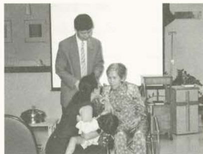
生命的長度無法延長，但卻可以讓病人生命的寬度延伸

寧療護方面的課程帶進北醫來，同學們對這門課的反應也相當地熱烈。另外，在去年北醫實習醫師結訓的時候，有些人覺得未來應該將安寧療護的內容安排進實習的課程中，因此在醫教會的幫忙之下，醫院和學校開始排定許多相關課程，未來會帶領各個實習醫師們來探索這一塊較陌生的領域。而北醫附設醫院腫瘤治療中心主任邱仲峰醫師認為，應該由醫學系系上自己開一堂有關安寧療護的必修課程，把為何成立安寧療護體系與其內容和重要觀念培植於未來準醫師