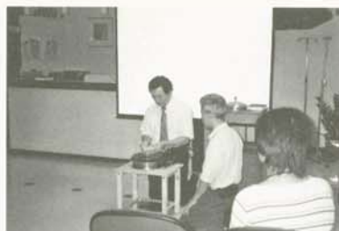
診治模式以尊重為首，並兼顧身心靈的診療，可以想見是甚為符合民情須要

人性照顧最重要的一環，一個安寧病房是否做得好，就要看心靈上的照顧有沒有做成功，醫護人員從各種不同的方面，在最後一段時間給病人的心靈做最完善的照顧，特別去關心病人的感覺，當醫生沒有辦法將疾病醫治好，醫護人員依然沒有放棄他，並且願意陪他好好地走完最後的這段時間。也就是說，當病人的疾病已經很嚴重的時候，最重要的是思考要怎麼樣做才是對他最好的，而不是如何將他治療好，因為每個人對生命的需求不同，想要達成的目標不同，醫護人員們應該要以病人為中心。這就