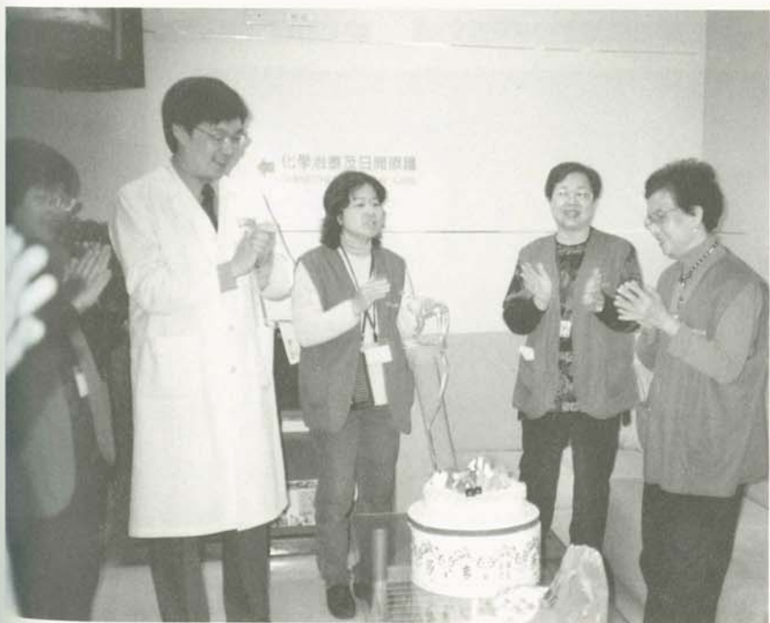
以一種積極「治療」的態度「緩和」身體不適，以求得身心安頓，達到平靜而「安寧」的生活品質，正是安寧緩和醫療的寫照